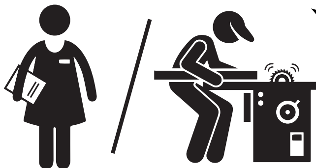
Un professionnel, moniteur, éducateur, tuteur